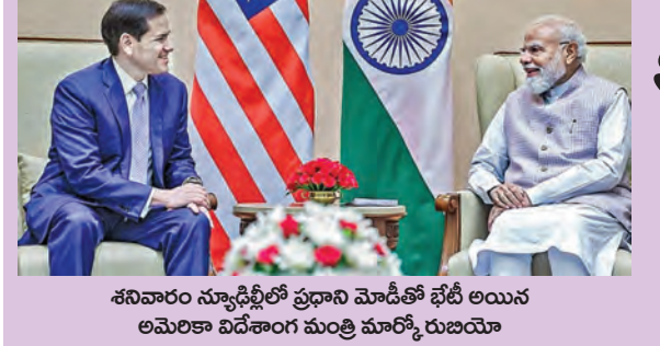
శనివారం న్యూఢిల్లీలో ప్రధాని మోడీతో భేటీ అయిన అమెరికా విదేశాంగ మంత్రి మార్కో రుబియో

ముంబయి, మే 23: సామాన్య, మధ్య తరగతి ప్రజలపై మరోసారి అధిక ధరల భారం పడింది. ప్రభుత్వ రంగ చమురు సంస్థలు ఇవాళ పెట్రోల్, డీజిల్ ధరలను మళ్ళీ పెంచాయి. తాజా పెంపుతో పెట్రోల్ లీటరు 87 పైసలు, డీజిల్ 91 పైసలు పెరిగాయి. దీంతో దేశ రాజధాని ఢిల్లీలో లీటరు పెట్రోల్ ధర రూ. 99.51కి చేరగా, డీజిల్ ధర రూ. 92.49కి చేరుకుంది. గత 10 రోజుల వ్యవధిలో అధిక ధరల పెంపులతో ఇది మూడోసారి. పశ్చిమాన యూపీ నెలకొన్న ఉద్రిక్తతలకారణంగా అంతర్జాతీయ మార్కెట్లో పెరిగిన ముడిపనుల ధరల భారాన్ని చమురు కంపెనీలు దశలవారీగా వినియోగదారులకు బదిలీ చేస్తున్నాయి. >>2 ఇందులో భాగంగా ఈనెల 15న లీటరు ఒకరూ. >>2