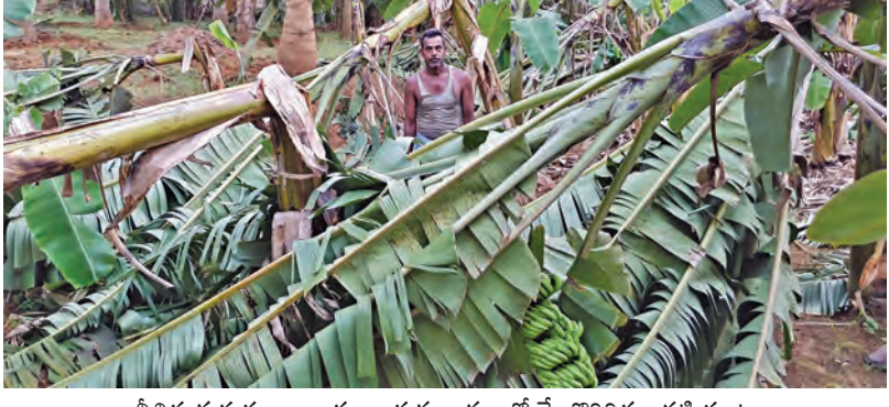
వీచిన ఈదురు గాలులకు నారుల గ్రామంలో నేలకొరిగిన ఆరటి పంట

గాలివాన బీభత్సం విజయవాడ, మే 23 ప్రభాతవార్త: పవీల్ నొ కొన్ని ప్రాంతాల్లో శనివారం సాయంత్రం తరువాత భారీ గాలివాన బీభత్సం సృష్టించింది. పవీల్ నొ అనకాపల్లి, కాకినాడ, తెలంగాణలోని నాగర్ కర్నూలు జిల్లాల్లో గాలి తో కూడిన వర్షం అల్లకల్లోలం సృష్టించింది. గాలివాన బీభత్సం కారణంగా పవీల్ ఇద్దరు, తెలంగాణలో ఒకరు మృత్యువాత పడ్డారు. పలుచోట్ల విద్యుత్ సరఫరా అంతరాయం ఏర్పడింది. అనకాపల్లి జిల్లా నక్కపల్లి, పామరకాపేట మండలాల్లో దాదాపు అరగంట పాటు గాలి, వాన రావడంతో చెట్లు, విద్యుత్ స్తంభాలు నెలకలగాయి. రమణయ్యపేట, ముకుందరాజుపేట, దోలపాడు, బీడిక, జి.జి.నాగపూర్, గోడివర్ర, వోకాడ, చినబొడ్డిపల్లి, కాకినాడ, రహదారి వంటి >>2