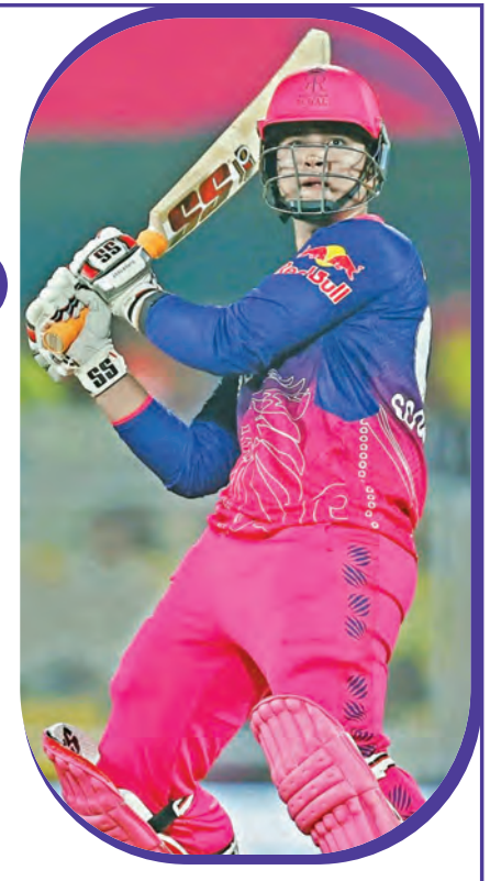
16 మ్యాచ్ లో... రాజస్థాన్ 15 మ్యాచ్ లో గెలుపొందాయి. అయితే వాంఖడేలో తలపడ గత 9 మ్యాచ్ లో అయిందీలో రాజస్థాన్ రాయల్స్ విజయం సాధించింది.

ఇండియన్ ప్రీమియర్ లీగ్ లో నేడు రెండు మ్యాచ్ లు జరుగనున్నాయి. వాంఖడే స్టేడియం వేదికగా జరిగే తొలి మ్యాచ్ లో రాజస్థాన్ రాయల్స్ ముంబై ఇండియన్స్ తలపడనుండగా... ఈ డేస్ గాబ్స్ వేదికగా జరిగే రెండో మ్యాచ్ లో కోల్కతా నైట్ రైడర్స్ ఢిల్లీ క్యాపిటల్స్ వాణి పడతాయి. ఫ్లే ఆఫ్ లోని నాలుగో టైర్ ఎఫెలదిన్నడ ఈ మ్యాచ్ లు తెల్లనున్నాయి. రాజస్థాన్, ముంబై మ్యాచ్ తో ఇది తలనుంది. దీంతో ఈ మ్యాచ్ తీర్పు ఆసక్తికరం. అందులో మొత్తం 15 ఏళ్లు కూడా పునె.